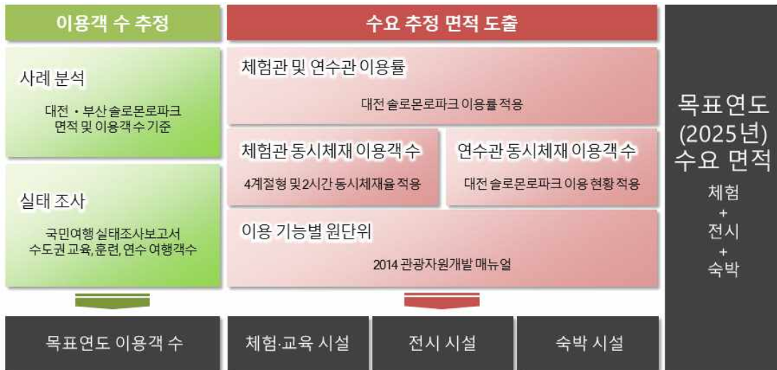
【그림 1 - 3 : 주요 도입시설 수요추정 Flow】