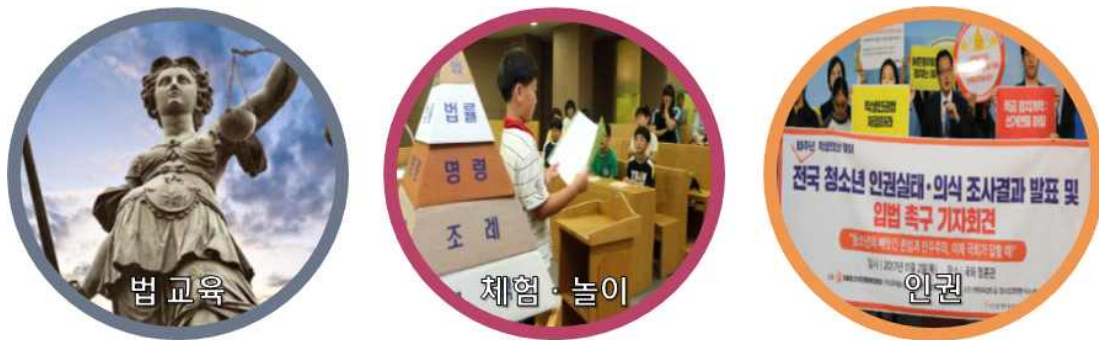
【그림 1 - 2 : 특화 기능 선정】