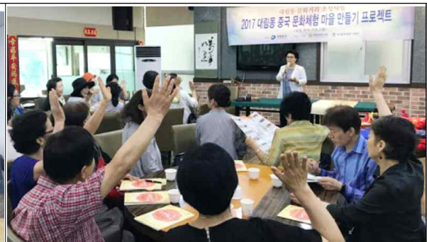
[소통을 통한 회의 운영]