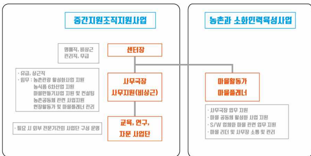
[남원시 농촌종합지원센터 조직체계]