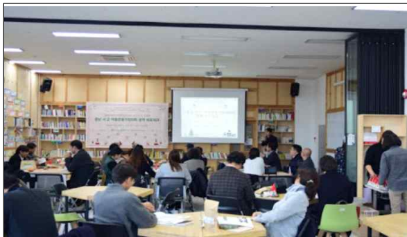
[중간조직에 의한 회의 운영]