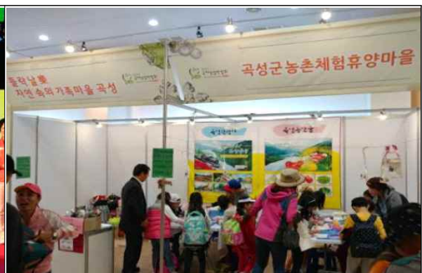
[박람회 참여 지원]