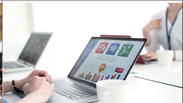
[회의 질적 향상을 위한 기록]