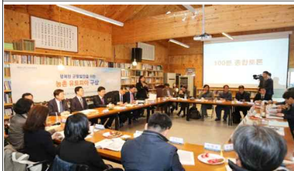
[종합토론 회의 운영]